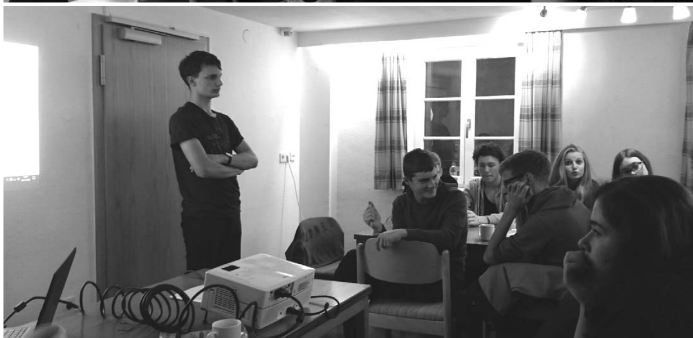
Die Projektgruppe „Schule als Staat“ bei der Arbeit während ihrer Klausurtagung.