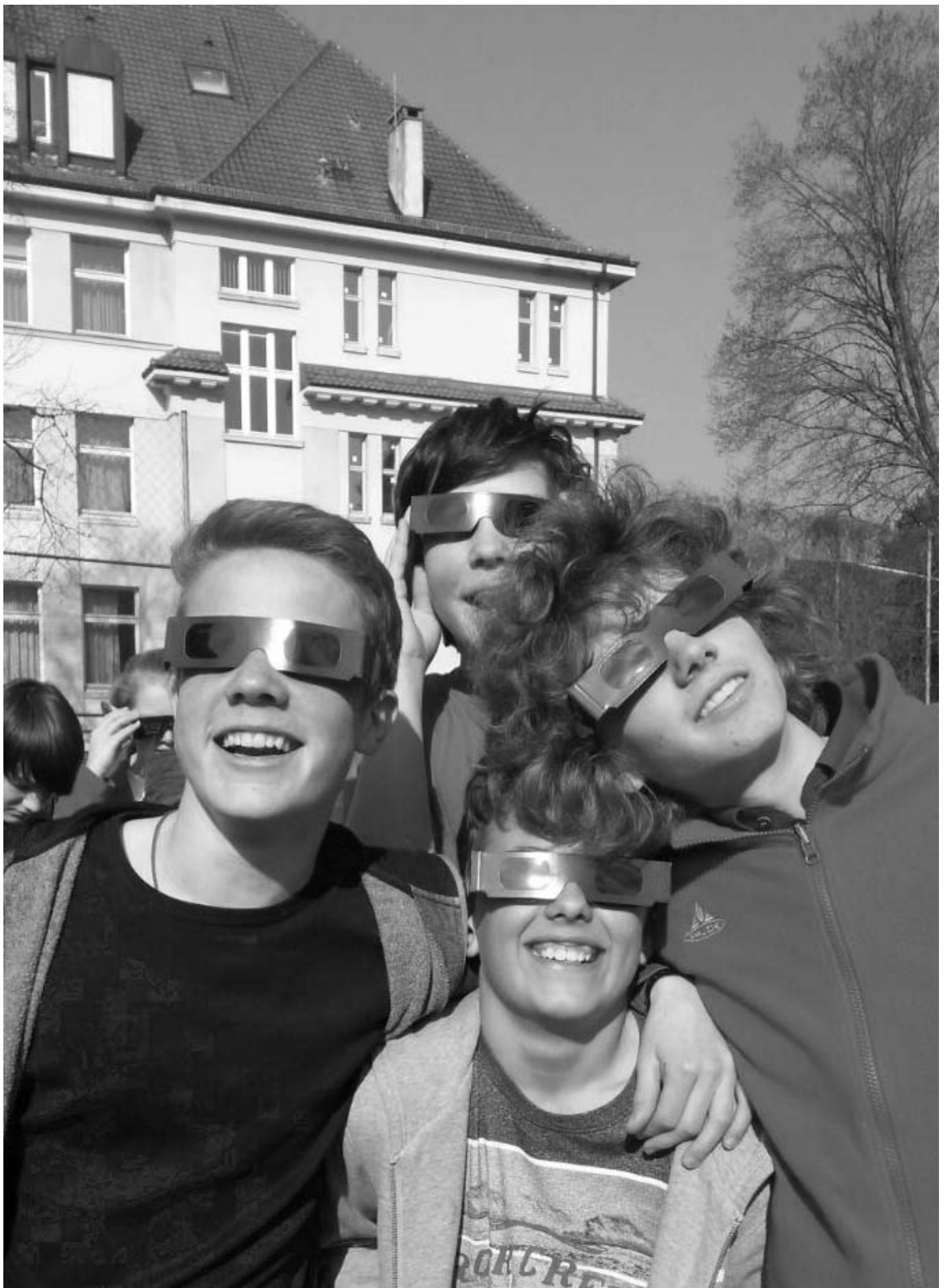
Am 20. März auf dem Sportplatz: Schüler der Kl. 8b verfolgen das Naturschauspiel mit Hilfe von Spezialbrillen.